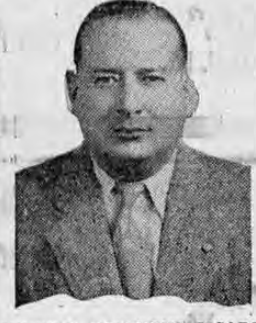
GENERAL DON RENÉ PICADO MINISTRO DE LA GUERRA